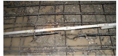
Bild 3. Fläche und Bewehrung nach Betonabtrag

Die Bewehrungsanschlüsse wurden zum Teil durch Anschweißen zur