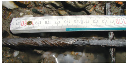
Bild 2. Chloridinduzierte Lochfraßkorrosion, sichtbar nach Freilegung der Bewehrung

Aufgrund der vorgefundenen Bausubstanz mit fehlendem Gefälle und ohne Abdichtung der Betonbauteile sowie der Lage in einem Gebiet mit starkem winterlichen Tausalzeinsatz wurde die Wahrscheinlichkeit einer Chloridkontamination des Betons im Bereich der waagerechten sowie der im Spritzwasserbereich liegenden senkrechten Bauteile als sehr hoch bewertet. Zur Bestimmung des Chloridgehaltes wurde an den genannten Bauteilen Bohrmehl in verschiedenen Tiefen bis zur Bewehrungslage entnommen. Der Chloridgehalt wurde anschließend potentiometrisch bestimmt. Dabei wurden Chloridgehalte von 0,4 – 0,5 M.-%, bezogen auf den Zementgehalt, als kritisch und potentiell Bewehrungskorrosion auslösend gewertet [2], [3]. Sowohl im Stützenbereich als auch im Bereich der Rampen, die mit 15% ein sehr starkes Gefälle aufweisen, wurden keine kritischen Chloridkonzentrationen festgestellt. Die im Bereich der senkrechten Bodenflächen gemessenen Chloridgehalte hingegen wiesen mit bis zu knapp unter 4 M.-% ein Vielfaches der tolerierbaren Werte auf. Unterhalb der oberen Bewehrungslage, in Tiefen von 5–6 cm, wurden keine erhöhten Chloridgehalte mehr festgestellt. In diesem Bereich wurde die Entnahme des Bohrmehls von der Deckenunterseite aus ange-